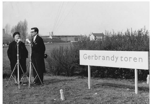
De naamgeving van de Gerbrandy toren op 28 april 1965

Op de volgende pagina de uitnodiging aan de secretaresse van Nozema voor het bijwonen van de naamgeving. In die brief staan de bijzonderheden van de plechtigheid.