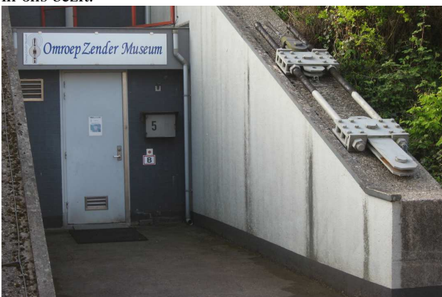
De tui spanner heeft een plaatsje gevonden bij de ingang van ons museum.

In Smilde gebeurt er altijd wat. Zo lijkt het althans. Dit voorjaar mochten we ruim een ton ophalen bij de toren (voor de duidelijkheid in gewicht) en later konden we de nodige oude spullen ophalen in het regiokantoor van Smilde dat door KPN is gesloten. Dit leverde ons veel en deels uniek materiaal op. Zoals een spanner uit een tuidraad die overbodig geworden is omdat met de bouw van de nieuwe mast alles van de tuien ook vernieuwd is. De voet waar de mast opstond is nu ook in ons bezit.