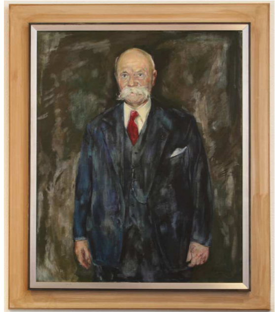
Het kopie schilderij is nu in bezit van het Omroep Zender Museum.

Door ondermeer inspanningen van Alticom, Novec en het OZM heeft het schilderij nu een plaats gevonden in de Vrije Universiteit. Op deze universiteit is Gerbrandy hoogleraar geweest.